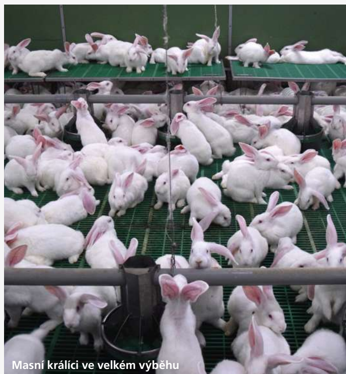
Masní králíci ve velkém výběhu