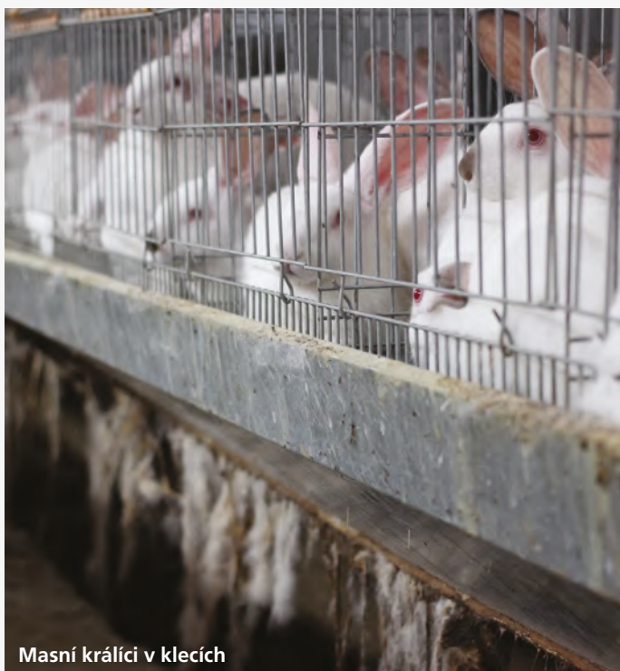
Masní králíci v klecích