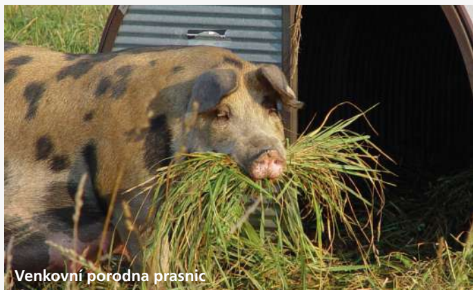
Venkovní porodna prasnic