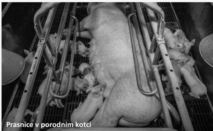
Prasnice v porodním kotci